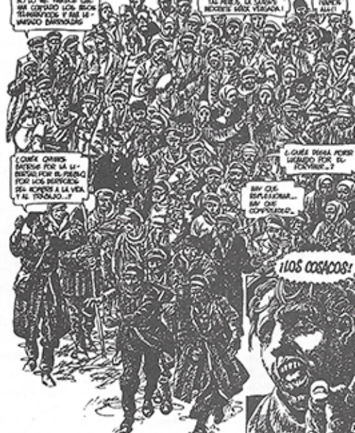
► Plancha de "EL DOMINGO ROJO". "Más que especializarme en temas de Historia, creo que es en temas de "masas", porque no hay nadie que las quiera hacer. No las hago nunca igual, ni recorro a dibujar caras redonditas. Me gusta entretenerme en cada personaje, y los hago a todos diferentes."