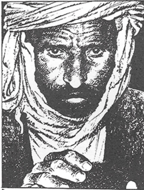
► "ARGELIA" (L.García-A.Usero)

► Yo no sabía encajar, tenía muchos apuros para dibujar pues no empecé copiando a nadie. Carlos se maravillaba cuando me veía dibujar porque no sabía lo que me iba a caer en la viñeta. Me costó mucho tiempo aprender