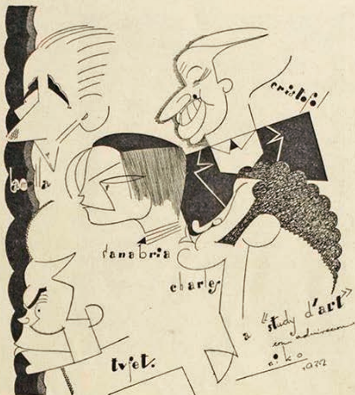
Els que integren «Studi d'Art» copcats pel fotògraf de neguits «NIKO».

Les plomes de Bagaria, «Niko», «Coke» i potser prou... (Deixarem «Caran d'Ache», «Bon», Lautrec, Grostz, «K-Hito.» Delarco). Prescindirem d'al·ludiraquelles firmes de la caricatura comentada, i que precisament només tenen impor-