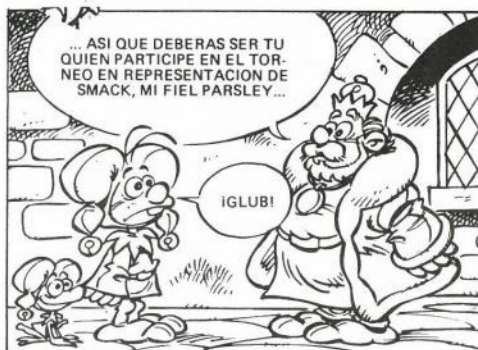
"Parsley", la mejor creación de Esegé, con la que ganó el Premio DIARIO DE AVISOS al mejor dibujante de humor, es un personaje que, en estos momentos está a la espera de encontrar su hueco vital