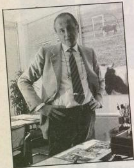
Boccaccio representava una mica aquella Barcelona dels anys 60 i 70, l'època en què es va acabar la importància del «què diran?».