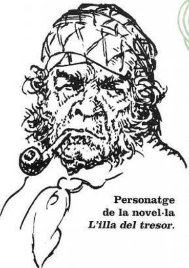
Personatge de la novel·la L'illa del tresor .