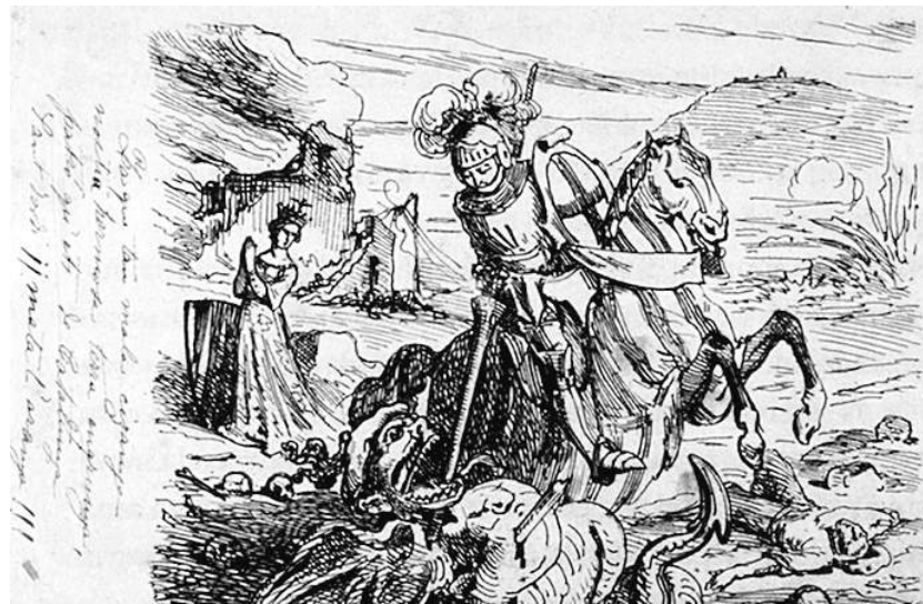
"Sant Jordi", por Apel·les Mestres. ILUSTRACIONES: BIBLIOTECA DE CATALUNYA

► Pese a la diferencia de edad, los dos artistas mantuvieron una intensa relación de amistad evocada por el ilustrador terrassense