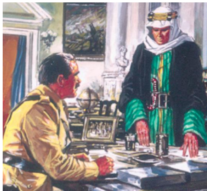
Portada de “Lawrence de Arabia”, inspirada en la película.