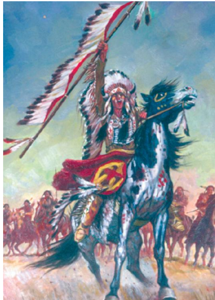
Cubierta de un cómic del Oeste.

ilustraciones a color para los cuadernos de las series Joyas Literarias Juveniles, Grandes Aventuras Juveniles, Trueno Color, Jabato Color, El Corsario de Hierro y El Sheriff King. Autores como Jules Verne, Emilio Salgari, Walter Scott, Edgar