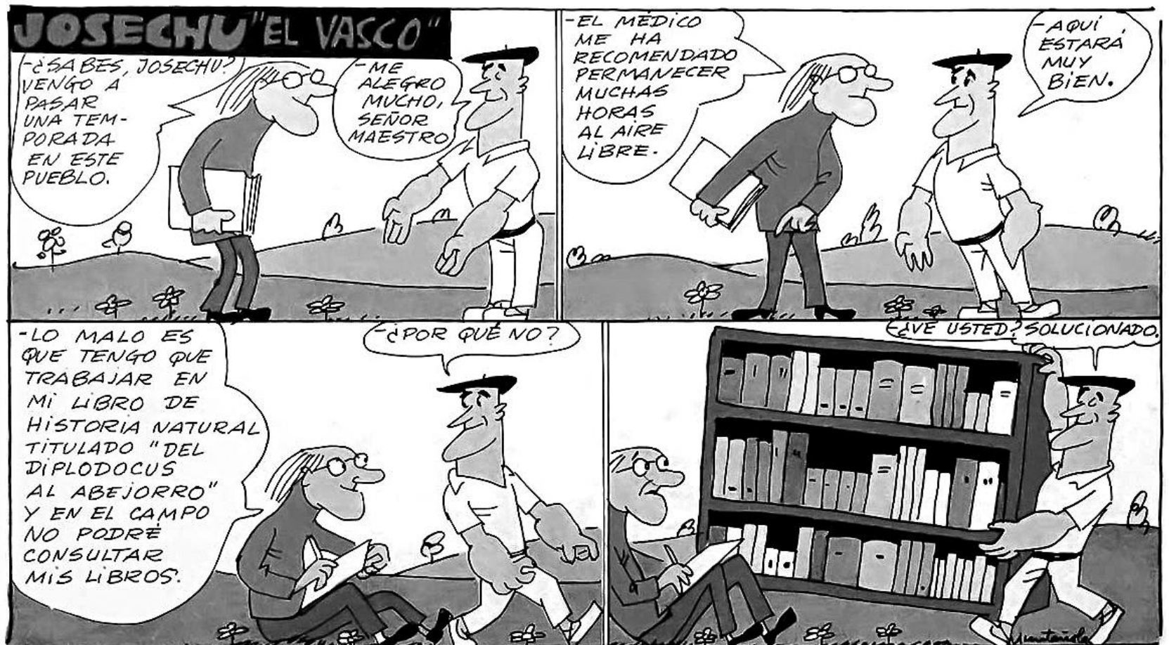
Historieta de "Josechu el Vasco" per al popular TBO. MUNTAÑOLA/OBRA SOCIAL CAIXA SABADELL