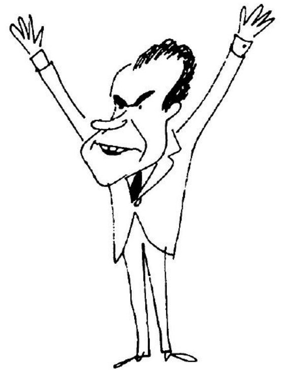
Caricatura de Nixon. MUNTAÑOLA/OBRA SOCIAL CAIXA SABADELL