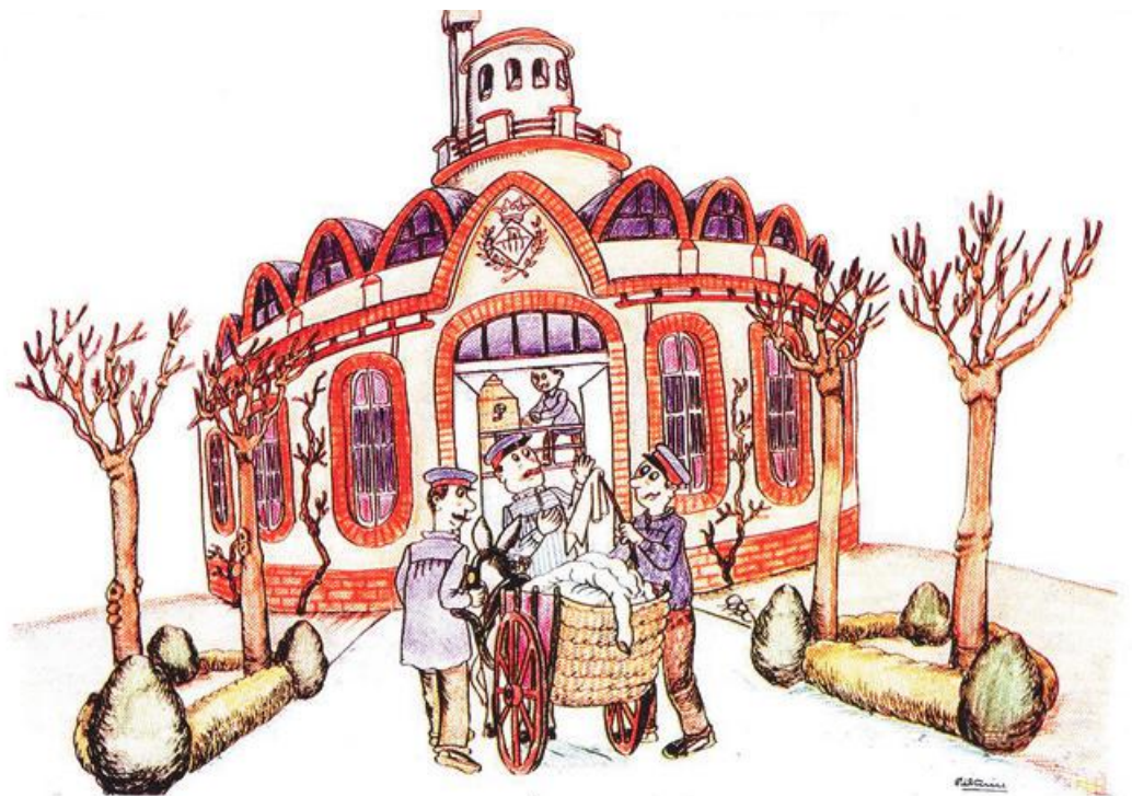
El Parc de Desinfecció (1912), de Josep Maria Coll i Bacardí. PILARÍN BAYÉS/ARXIU TOBELLA

Para llevar a cabo esta tarea de reconstrucción histórica,