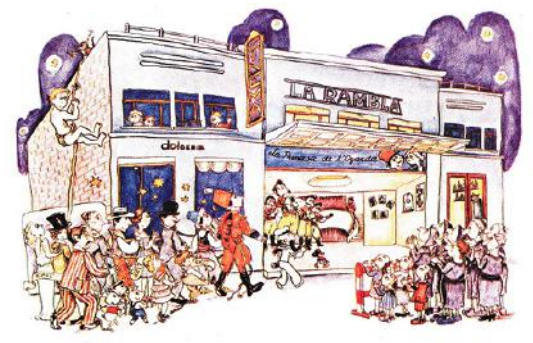
Cinema Rambla (1934).