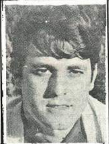
PAGINA DE MANUEL E. DARIAS

un poblado indio, un "saloon"... y se simulaban asaltos al banco, etcétera. Pero aquel negocio no le salió tan bien como él esperaba.