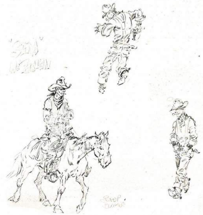
Diversos bocetos de Jordi Buxadé (especial para esta página)