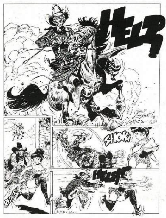
Dos historietas de Jordi Buxadé en las que puede apreciarse su profundo dominio del western.